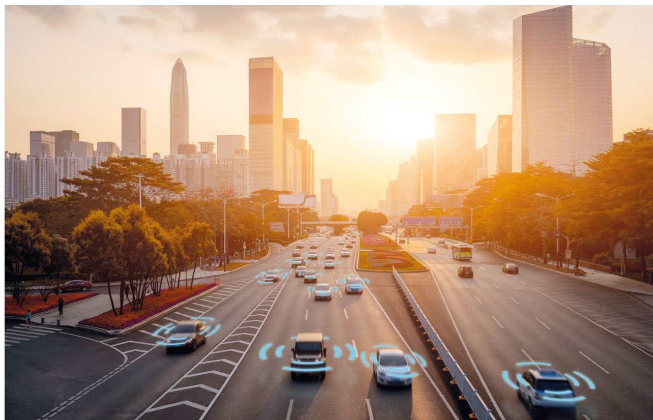
Ob fortschrittliche Fahrerassistenzsysteme oder Connectivity-Features: Software ist inzwischen Haupttreiber zahlreicher Innovationen für Automobile und verändert in dem Zuge den Validierungsprozess

Lange Zeit spielte die Software im Fahrzeugentwicklungsprozess eine untergeordnete Rolle. Sie wurde erst nach den mechanischen Komponenten und der Hardware entwickelt und integriert. Doch inzwischen ist sie Haupttreiber zahlreicher Innovationen und bestimmt maßgeblich die Funktionalität der Automobile – etwa mit Blick auf fortschrittliche Fahrerassistenzsysteme (ADAS) sowie Infotainment- und Connectivity-Features. Mehr denn je gilt: Die Software entscheidet darüber, ob ein Modell von Kunden angenommen wird oder nicht.