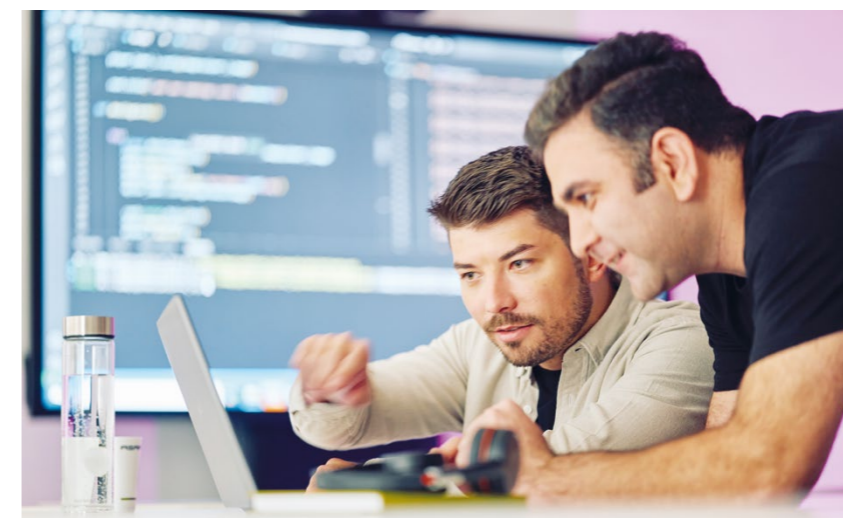
Die ASAP Gruppe hat ein modulares und skalierbares End-to-End-Validierungssystem mit dem Namen TestSphere entwickelt, das den gesamten Prozess vereinfacht und beschleunigt.

In dem Zuge ist es alternativlos, die Validierung von Hardware-in-the-Loop auf Software-in-the-Loop-Systeme (HiL- bzw. SiL-Systeme) zu verlagern und die SiL-Systeme modularer und skalierbarer zu machen. Der Ansatz, die Softwareentwicklung und -validierung gleich zu Beginn zu integrieren, wird als „Shift Left“ bezeichnet. Er ermöglicht es, Unstimmigkeiten und Fehler zu einem sehr frühen Zeitpunkt zu erkennen und zu beseitigen und trägt außerdem dazu bei, dass die Software während des gesamten Entwicklungsprozesses die entsprechenden Qualitätsstandards erfüllt.