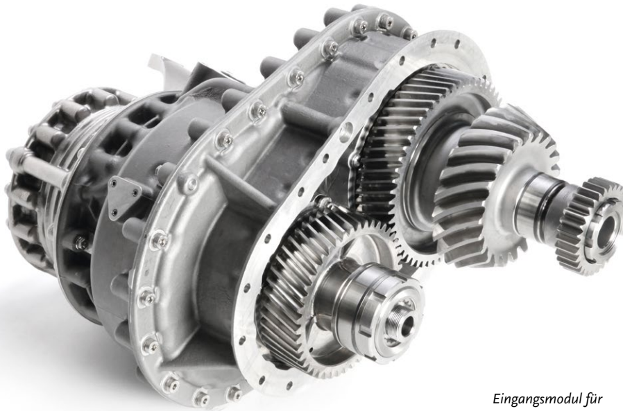
Eingangsmodul für Hochleistungsgetriebe

Leistungen Engineering Prototypenfertigung Systemtests