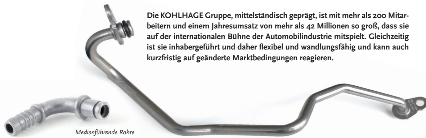
Medienführende Rohre zum Beispiel für Ölvorlaufleitungen.

Die KOHLHAGE Gruppe, mittelständisch geprägt, ist mit mehr als 200 Mitarbeitern und einem Jahresumsatz von mehr als 42 Millionen so groß, dass sie auf der internationalen Bühne der Automobilindustrie mitspielt. Gleichzeitig ist sie inhabergeführt und daher flexibel und wandlungsfähig und kann auch kurzfristig auf geänderte Marktbedingungen reagieren.