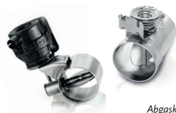
Abgasklappen Flexibler modularer Baukasten