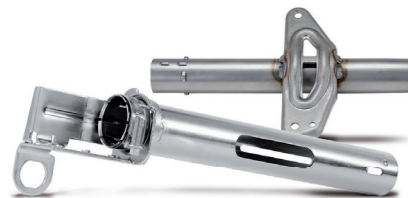
Sicherheitsrelevante Baugruppen sorgen für Sicherheit

Vor 20 Jahren war KOHLHAGE Automotive dafür bekannt, Rohre biegen zu können. Dieses Produktions Know-how ist in den Jahren derart verfeinert worden, dass KOHLHAGE Produkte heute fester Bestandteil in einer Vielzahl automotiver Projekte sind. Das Spektrum reicht von der Abgasklappe für Pkw, Nutzfahrzeuge und Motorräder über medienführende Rohrleitungen, die im Powertrain-Bereich verbaut werden, bis hin zu sicherheitsrelevanten Baugruppen und Strukturbauteilen.